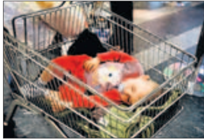
«Shoppern bis zum Umfallen» – künftig auch im Glattzentrum.